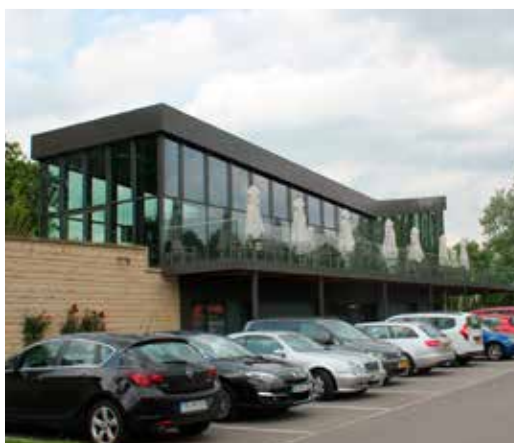
P18 - Pavillon à vins - Bistro Quai