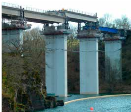
P05 - Reconstruction des tabliers d'un pont à Insborn