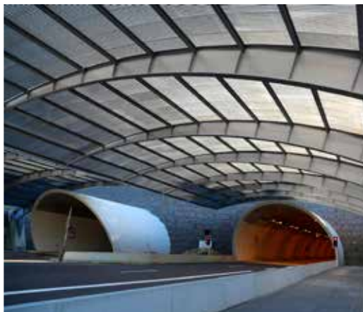
P25 - Auvents portail tunnel Grouft