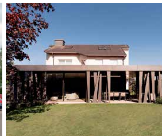
P28 - Extension d'une maison unifamiliale à Bertrange