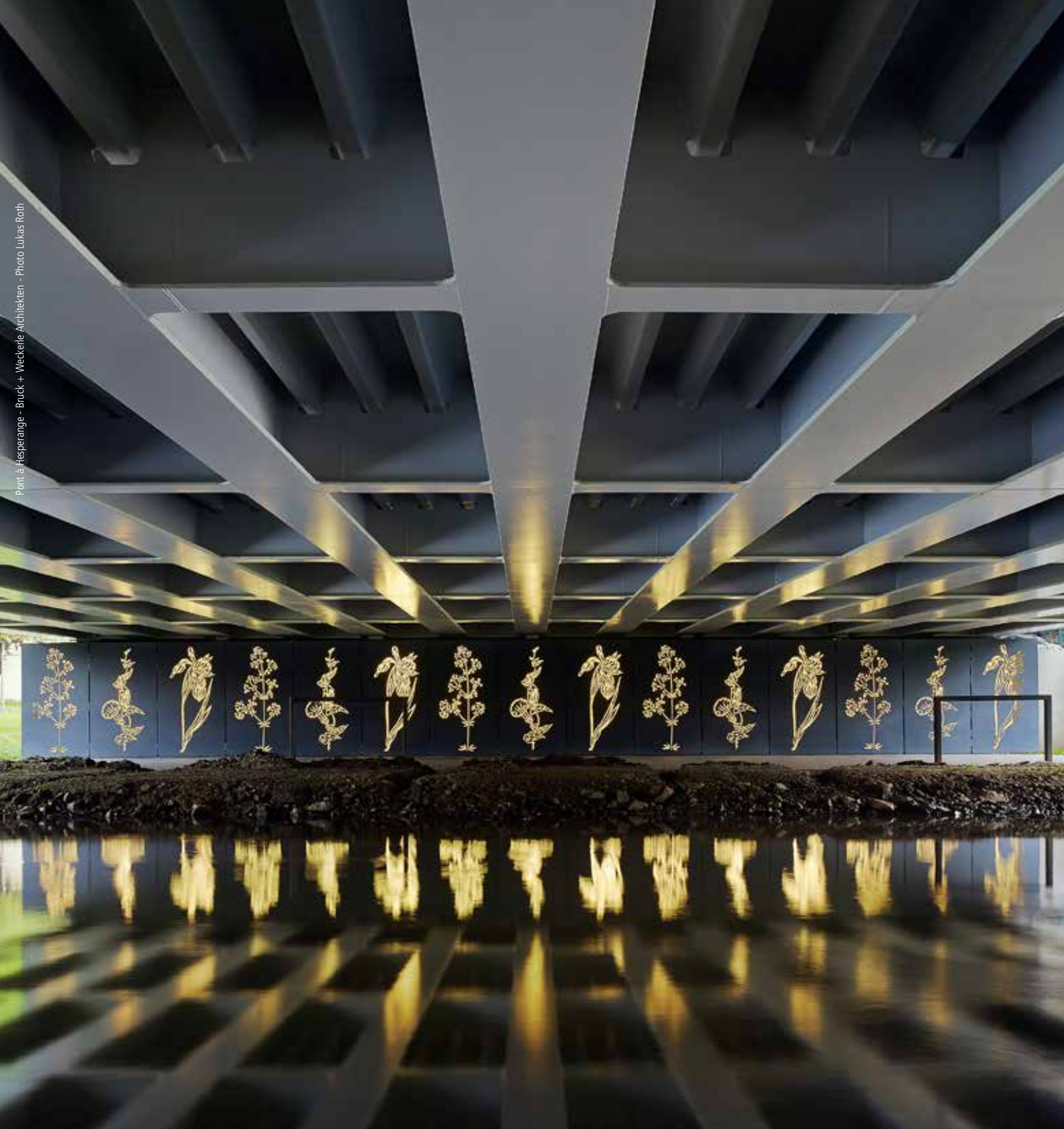
Pont à Hesperange - Bruck + Weckerle Architekten