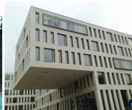
P14 - Immeuble administratif IAK