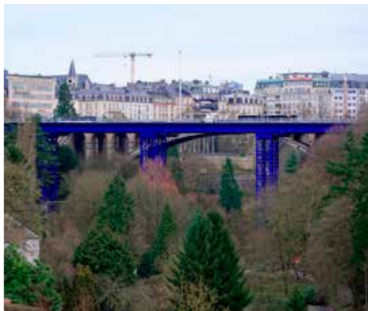
P06 - Pont bleu provisoire

Ce 30 juin dernier, le jury a nominé 11 projets. Les lauréats seront révélés lors de la Journée Construction Acier du 10 novembre 2015 à Luxembourg.