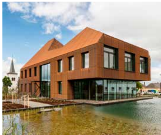
P12 - Mairie d'Esch-sur-Sûre