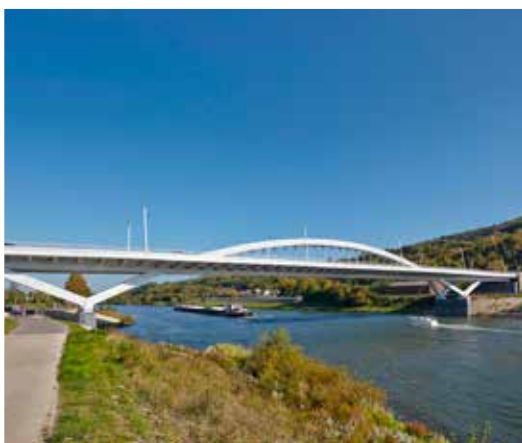
P07 - Pont de Grevenmacher