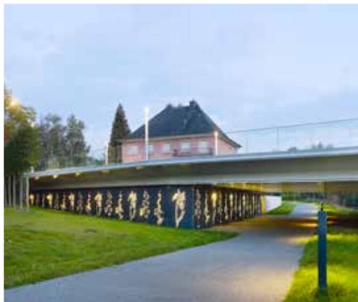
P18 - Reconstruction d'un pont routier à Hesperange