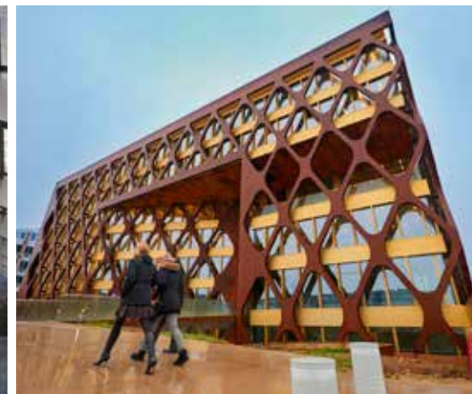
P02 - Immeuble de bureau KPMG