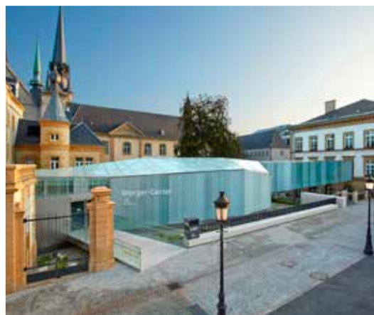
P22 - Passerelle Bierger Center